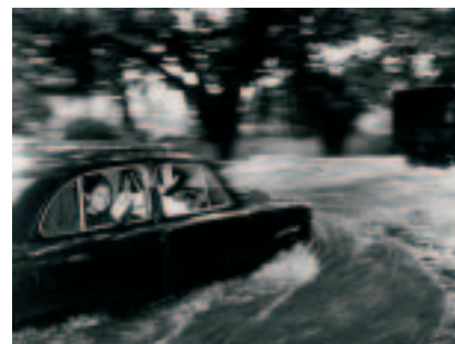
Carl de Keyzer